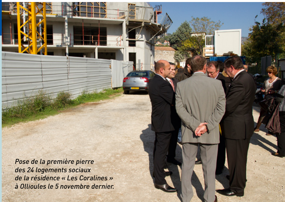
Pose de la première pierre des 24 logements sociaux de la résidence « Les Corallines » à Ollioules le 5 novembre dernier.