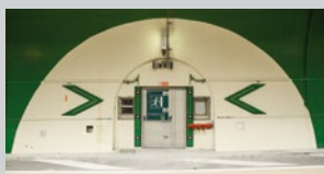
Issue de secours