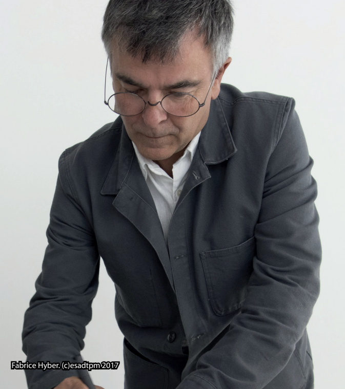
Fabrice Hyber.

Cet artiste intervient au sein des formations du 2 ème cycle et met en place un projet artistique avec les étudiants. L'artiste Fabrice Hyber qui était le premier invité en 2016-2017, clôturant son parcours pédagogique par un « C'Hyber Rallye », ouvert à tous les publics, véritable parcours artistique disséminé sur le territoire de la Métropole.