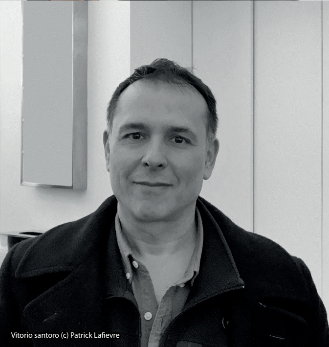
Vittorio santoro (c) Patrick Lafievre

En 2017-2018 l'artiste Vittorio Santoro a travaillé avec les étudiants autour d'un projet collectif, prenant la forme d'un journal largement inspiré des publications artistiques et littéraires de la première moitié du XX e siècle et pour lequel les étudiants ont proposé des contributions en résonance avec leurs recherches. Pour l'année 2019-2020 Moussa Sarr, ancien diplômé de l'ESADTPM et ancien pensionnaire de la Villa Medicus, est l'artiste invité.