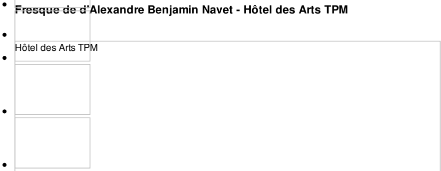
Hôtel des Arts TPM